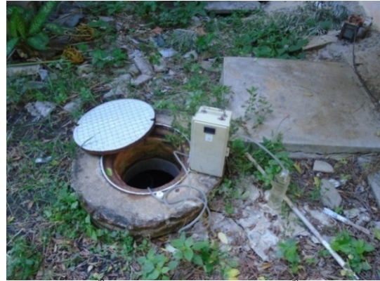
สถานีบ่อบักน้ำใสบ่อบสุดท้ายของระบบบำบัดน้ำเสีย (W2)