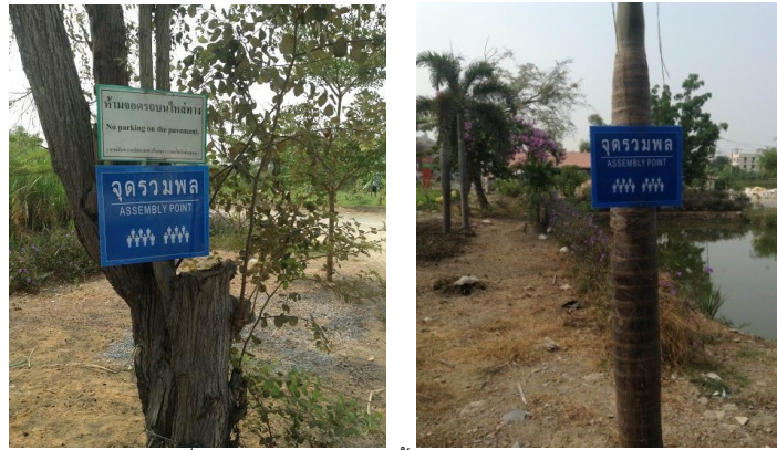
ภาพที่ 5-15 ป้ายจุดรวมพลทั้งสองแห่งของโครงการ

รายงานผลการปฏิบัติตามมาตรการป้องกันแก้ไขผลกระทบสิ่งแวดล้อม และมาตรการติดตามตรวจสอบคุณภาพสิ่งแวดล้อม โครงการ สถานพยาบาลศาลายาเนอรัลซิงโฮม(ส่วนขยายของโรงพยาบาลศาลายา) ตั้งอยู่ที่ 95 หมู่ 3 ต.ศาลายา อ.พุทธมณฑล จ.นครปฐม