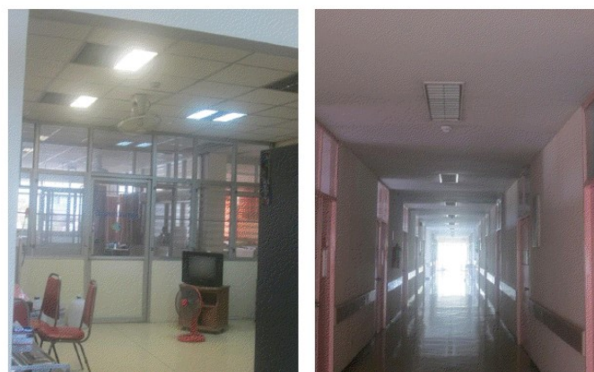
ภาพที่ 5-17 ติดตั้งเครื่องตรวจจับควัน (Smoke Detector) เพิ่มเติมบริเวณโถงทางเดินชั้น 2 , ห้องโถงหน้าลิฟท์ , ห้องทำงานพยาบาล , ห้องพิเศษของทุกชั้น และบริเวณห้องโถงทางเดินภายในอาคาร