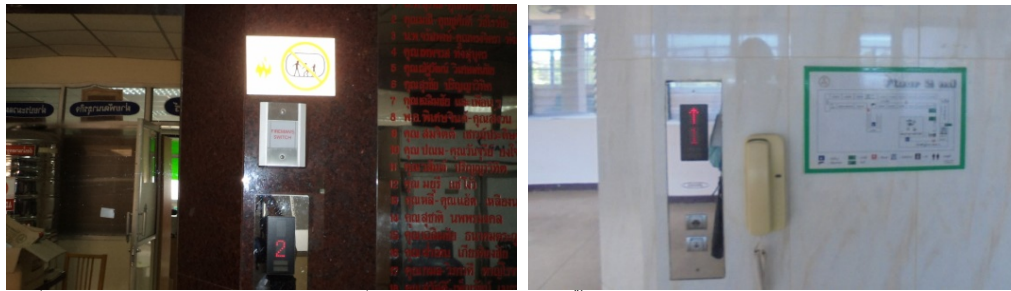
ภาพที่ 5-11 สัญญาณเตือนเพลิงไหม้แบบกริ่ง (Fire Alarm Bell) ติดตั้งไว้บริเวณหน้าลิฟท์ และป้ายบอกตำแหน่งทางหนีไฟ

รายงานผลการปฏิบัติตามมาตรการป้องกันแก้ไขผลกระทบสิ่งแวดล้อม และมาตรการติดตามตรวจสอบคุณภาพสิ่งแวดล้อม โครงการ สถานพยาบาลศาลายาเนอรัลซิงโฮม(ส่วนขยายของโรงพยาบาลศาลายา) ตั้งอยู่ที่ 95 หมู่ 3 ต.ศาลายา อ.พุทธมณฑล จ.นครปฐม