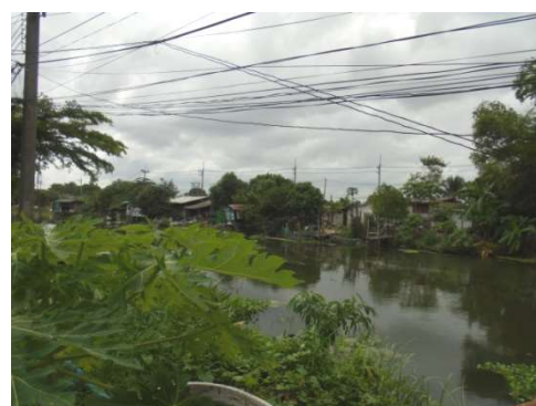
ภาพที่ 5-24 สภาพปัจจุบันคลองมหาสวัสดิ์ มี.ค.65 และ พ.ค.65