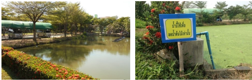
ภาพที่ 5-1 บ่อน้ำ 3 ด้านหน้าอาคารโรงพยาบาลสำหรับเป็นบ่อหน่วงน้ำของโครงการ และปัจจุบันปรับปรุงเป็นบ่อบำบัดน้ำเสียชนิดเดิมอากาศ โดยใช้เครื่องปั๊มตักน้ำ และติดตั้งเป็นน้ำใช้รดน้ำต้นไม้

รายงานผลการปฏิบัติตามมาตรการป้องกันแก้ไขผลกระทบสิ่งแวดล้อม และมาตรการติดตามตรวจสอบคุณภาพสิ่งแวดล้อม โครงการ สถานพยาบาลศาลายาเนอรัลซิงโฮม(ส่วนขยายของโรงพยาบาลศาลายา) ตั้งอยู่ที่ 95 หมู่ 3 ต.ศาลายา อ.พุทธมณฑล จ.นครปฐม