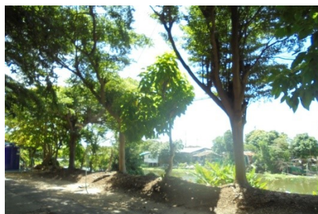
ภาพที่ 5-20 ปลูกลูกต้นไม้เพิ่มเติมบริเวณคันดินด้านหลังโครงการ