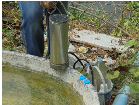
สถานีคลองมหาสวัสดิ์หลังจากผ่านพื้นที่โครงการ (W5)