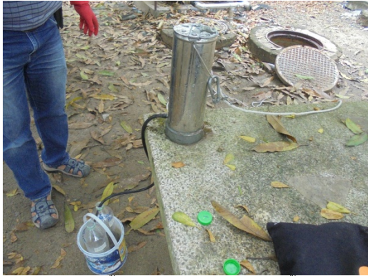
สถานีบ่อบักน้ำสุดท้ายก่อนเข้าระบบบำบัดน้ำเสีย (W1)