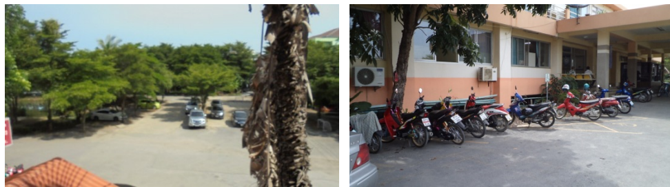
ภาพที่ 5-3 ลานจอดรถภายในพื้นที่โครงการ