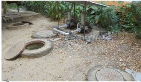
ภาพที่ 5-6 ระบบบำบัดน้ำเสียด้านหลังอาคารโรงพยาบาล ได้รับการซ่อมแซมอยู่ในสภาพใช้งานได้

รายงานผลการปฏิบัติตามมาตรการป้องกันแก้ไขผลกระทบสิ่งแวดล้อม และมาตรการติดตามตรวจสอบคุณภาพสิ่งแวดล้อม โครงการ สถานพยาบาลศาลายาเนอร์สซิงโฮม(ส่วนขยายของโรงพยาบาลศาลายา) ตั้งอยู่ที่ 95 หมู่ 3 ต.ศาลายา อ.พุทธมณฑล จ.นครปฐม