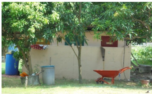
ภาพที่ 5-8 ห้องพักขยะรวม แบ่งเป็น 3 ห้องได้แก่ ขยะทั่วไป, ขยะรีไซเคิล และขยะติดเชื้อ