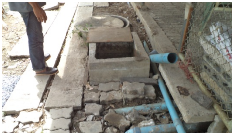
ภาพที่ 5-7 บ่อดักไขมันอยู่บริเวณห้องครัวของโครงการ ตักตะกอนไขมันออกทุกสัปดาห์