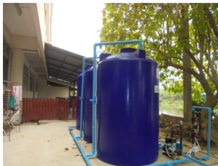
ภาพที่ 5-27 ถังสำรองน้ำใช้ และระบบประปา