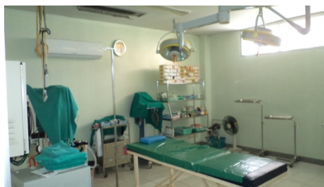
ภาพที่ 5-5 ติดตั้งเครื่องผลิตโอโซน บริเวณห้องผ่าตัดของโรงพยาบาล