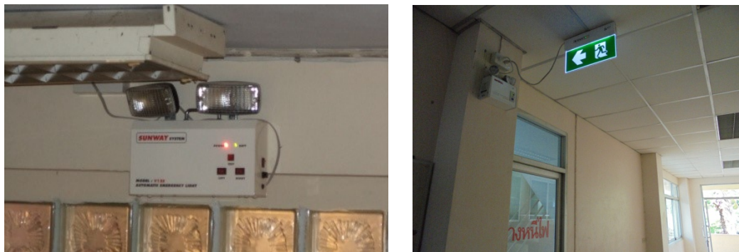
ภาพที่ 5-13 ติดตั้งไฟส่องสว่างฉุกเฉินบริเวณบันไดหนีไฟและทางออกบันไดหนีไฟ และป้ายบอกทางหนีไฟเรืองแสง