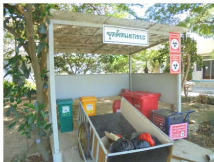
ภาพที่ 5-10 ถังรองรับมูลฝอยภายในอาคารโรงพยาบาล สีเขียว สีแดงและสีน้ำเงิน คัดป้ายชนิดขยะที่ฝังทุกถัง