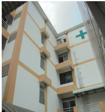
ภาพที่ 5-26 ช่องเปิดระบายอากาศภายในอาคาร