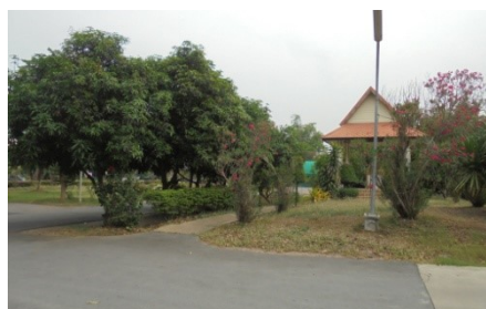
ภาพที่ 5-19 ต้นไม้บริเวณสวนหย่อมของโครงการ