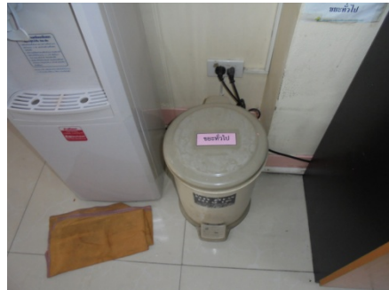
ภาพที่ 5-9 ถังรองรับมูลฝอยภายในห้องรักษาพยาบาล