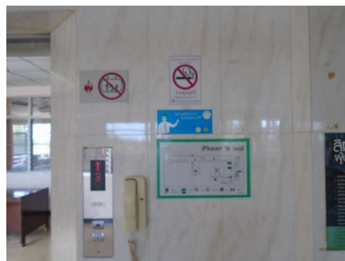
ภาพที่ 5-23 ติดตั้งป้ายห้ามสูบบุหรี่ไว้ตามจุดต่างๆ ของโครงการ