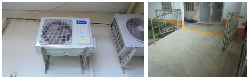
ภาพที่ 5-4 เลือกใช้เครื่องปรับอากาศประหยัดไฟเบอร์ 5 และทำทางลาดบริเวณทางเข้าโรงพยาบาล