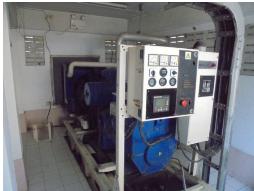
ภาพที่ 5-25 ท่อไอเสียเครื่องกำเนิดไฟฟ้าสำรอง ห้องเครื่องไฟฟ้าและห้องเครื่องไฟฟ้าสำรอง