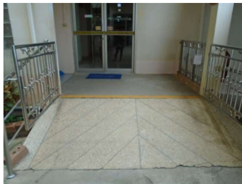
ภาพที่ 5-22 ทำทางลาดขึ้นทุกจุดของโรงพยาบาล