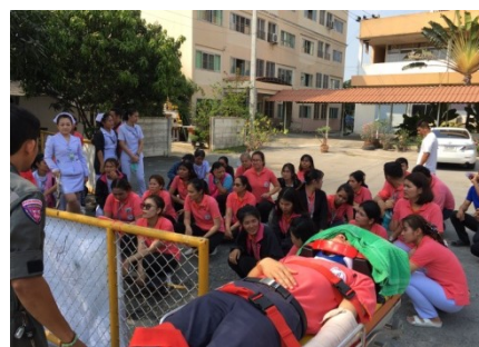
ภาพที่ 5-18 การอบรมดับเพลิงและซ้อมอพยพหนีไฟของโครงการ