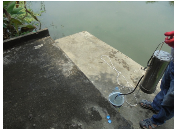
สถานีคลองมหาสวัสดิ์ก่อนที่จะไหลผ่านพื้นที่โครงการ (W4)