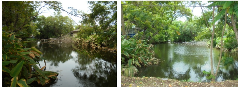
ภาพที่ 5-2 บ่อน้ำ 1 ใช้สำหรับรดน้ำต้นไม้ภายในโครงการ