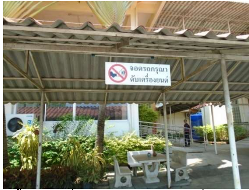
ภาพที่ 5-21 ติดตั้งป้ายดับเครื่องยนต์ขณะจอดรถไว้บริเวณที่จอดรถของโครงการแล้ว

รายงานผลการปฏิบัติตามมาตรการป้องกันแก้ไขผลกระทบสิ่งแวดล้อม และมาตรการติดตามตรวจสอบคุณภาพสิ่งแวดล้อม โครงการ สถานพยาบาลศาลายาเนอร์สซึ่งโฮม(ส่วนขยายของโรงพยาบาลศาลายา) ตั้งอยู่ที่ 95 หมู่ 3 ต.ศาลายา อ.พุทธมณฑล จ.นครปฐม