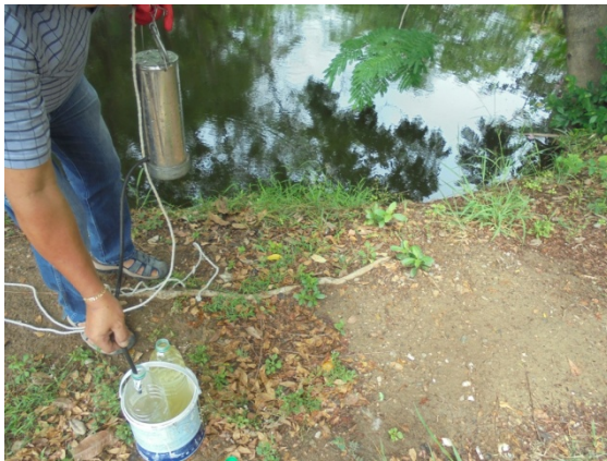
สถานีบ่อบักน้ำสุดท้ายของโครงการ (W3)