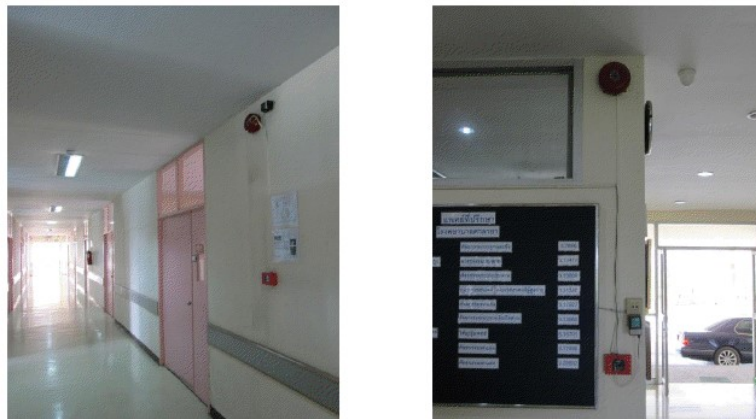
ภาพที่ 5-16 ติดตั้งระบบแจ้งเหตุแบบใช้มือ (Manual Station) และ Alarm Bell บริเวณโถงทางเดินชั้น 1 และ 2 ของอาคาร